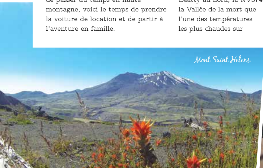
Mont Saint Helens

terre a été relevée: 56.6°C à Furnace Creek en 1913. Après une semaine en montagne et dans le froid de Rainier et de St Helen's, je me retrouve devant le thermomètre du centre des visiteurs avec, devant les yeux, un 48.9°C! J'ai la peau qui brûle et les sandales qui collent au sol. ☹️