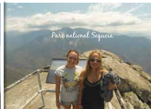
Parc national Sequoia