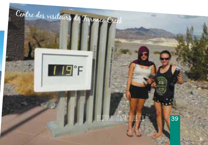
Centre des visiteurs de Furnace Creek