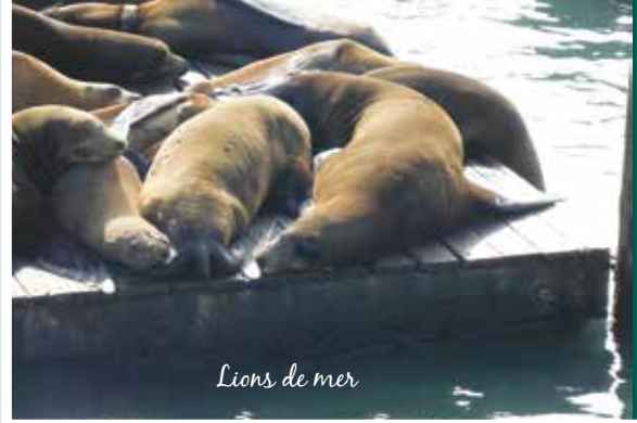
Lions de mer

Les endroits touristiques de prédilection sont le Fisherman Wharf et le Quai 39 où les restaurants, les boutiques et les fameux lions de mer sont à l'honneur. Ses derniers sont arrivés en 1990, à la suite du violent tremblement de terre de Loma Prieta . Ils crient, ils sentent mauvais et pourtant ils sont une des attractions majeures du port.