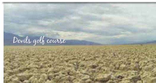
Devils golf course

Bad Water , qui est situé à 86 mètres sous le niveau de la mer, est le point le plus bas d'Amérique du Nord. L'endroit est très bien aménagé et on peut s'aventurer sur l'immense lit de sel laissé par l'ancien lac. Je n'ai pu résister à goûter un minuscule morceau de sel jonchant le sol. Vite de l'eau... Nous passerons deux jours à parcourir le parc en passant par, Devil's golf course , Artist's Drive , Golden Canyon , et Zabriskie Point .