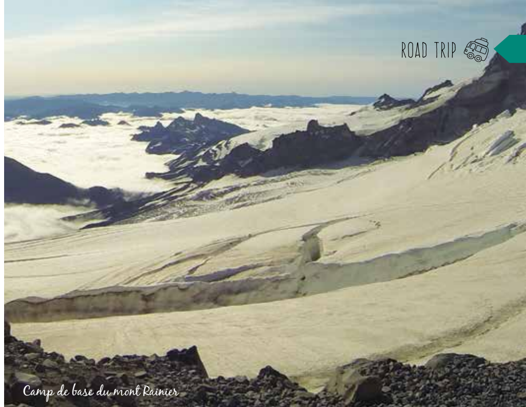
Camp de base du mont Rainier

Qu'on se le dise, le point culminant de l'état ne laisse que la moitié des grimpeurs atteindre son sommet. Un permis spécial est nécessaire pour monter au-delà de 10 000 pieds et le sommet peut être atteint en 12 heures si le grand manitou le veut bien. La mauvaise température m'oblige à entrer dans les statistiques d'abandon. Les deux volcans les plus puissants et les plus explosifs, le mont Rainier en sommeil et le mont Saint Helens actif, se tiennent côte à côte dans la chaîne des Cascades. Je grimpe donc le second en guise de compensation.