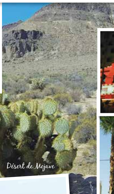
Désert de Mojave