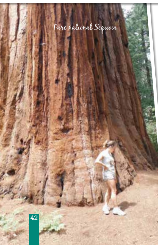
Parc national Sequoia