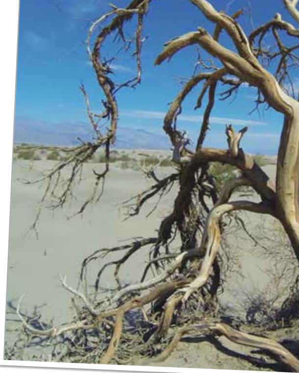
Dunes de Mesquite

Dante's View , à 1600 mètres d'altitude, qui est accessible en voiture, est le point de vue le plus élevé du parc offrant une vue imprenable sur toute la vallée. Tout juste en face, le Telescope Peak , haut de 3366 mètres, est le point culminant de la vallée. Dès notre arrivée en voiture, de forts vents à en perdre sa perruque et un ciel noir à faire peur nous poussent à fuir le sommet.