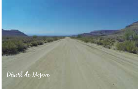
Désert de Mojave

À moins d'une heure de Las Vegas se trouve le Hoover Dam . Construit en 1931, ce barrage, d'une longueur de 380 mètres et 221 mètres de hauteur, est sans contredit une prouesse de conception. Il enjambe la rivière Colorado, entre l'Arizona et le Nevada.